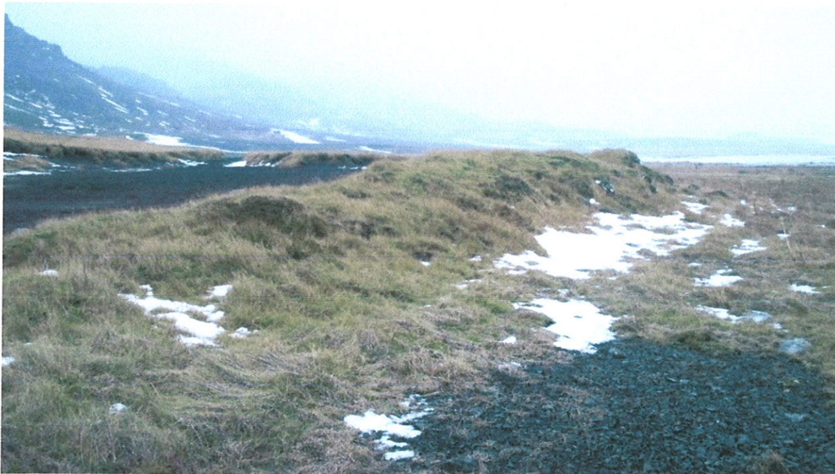
Mynd 3. Friðlýstur túngarður við Kaldrana. Horft í norður.